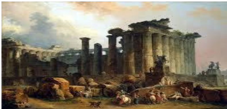
рис.4 Гюбера Робера

В XVIII веке акварель получила широкое применение при оформлении архитектурных проектов, фонтанов, и т.п. Известны блестящие по исполнению и глубокие по замыслу акварельные образцы архитектурного пейзажа французского