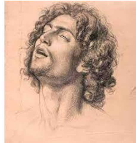
рис.2.Картина и эскиз

К этой грандиозной картине созданы около 200 подготовительных эскизов и этюдов, в т. ч. карандашом. И каждый-шедевр иллюзорного искусства. Линия А Иванова-это живое пространство, художник через выразительные средства обычного карандашного грифеля демонстрирует художественные образы. Линия у него в рисунках то спокойно – плавная, то экспрессивная, то исчезает в свету, то появляется снова, видимая в полутонах, приобретает силу в тенях, поражая зрителей своей выразительностью (рис.2).Как видим, линия в рисунке, его стилистика определяет выразительность создаваемого художественного образа в архитектурном рисунке. Таков, к примеру рисунок, выполненный на доске известным итальянским художником педагогом начала