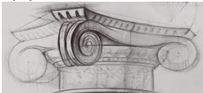
Рис. Пример линейного рисунка

У студентов архитектурных направлений линия и цвет в рисунке-эскизе имеет свою выраженную специфику, характерные особенности выражения архитектурных форм. И поскольку рисунок в архитектуре имеет свою специфику, линия выступает как определяющий фактор выражения замысла.