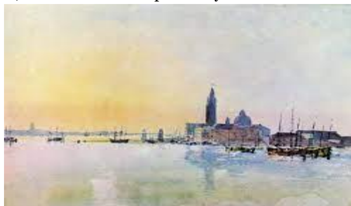
рис.5 . Тёрнер.пейзаж

XIX век можно считать крупной вехой в развитии английской акварельной школы. Такие мастера кисти и карандаша, как Констебль и Тёрнер создали целую серию акварельных произведений, раскрывших богатейшие изобразительные возможности техники акварели. Их работы отличают прежде всего прозрачность, мастерская передача тончайших явлений воздушной перспективы, нежнейший колорит и глубинные связи человека с природой.